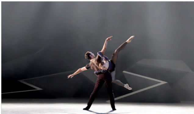
One of a Kind | Das Stuttgarter Ballet - Jiří Kylián