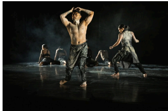
Whenua - New Zealand Dance Company