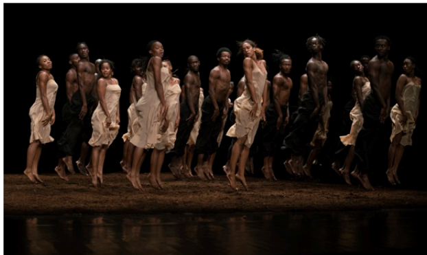
The Rite of Spring | common ground[s] - Pina Baush