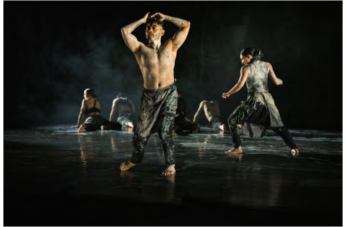
Whenua - New Zealand Dance Company