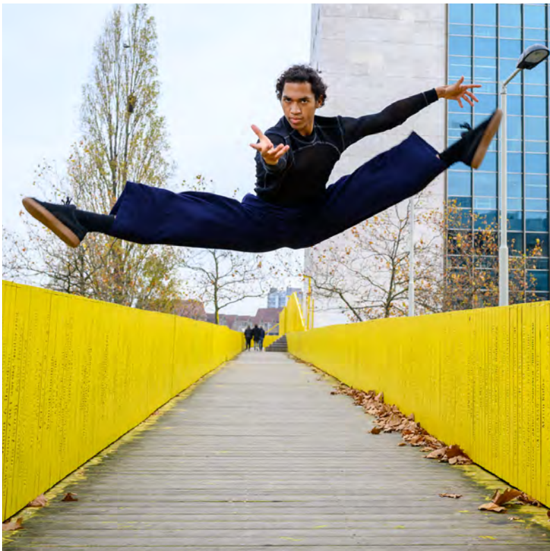
Talent on the Move