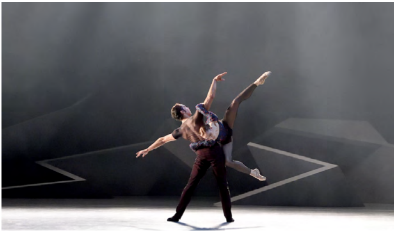
One of a Kind | Das Stuttgarter Ballet - Jiří Kylián