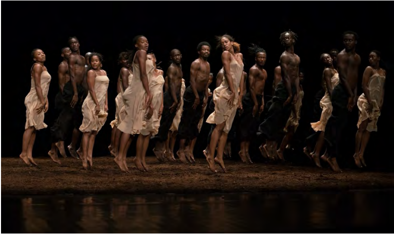
The Rite of Spring | common ground[s] - Pina Baush